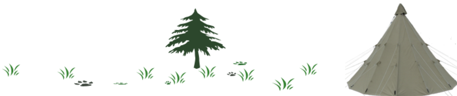
Mindre Pløk Strop Bunden